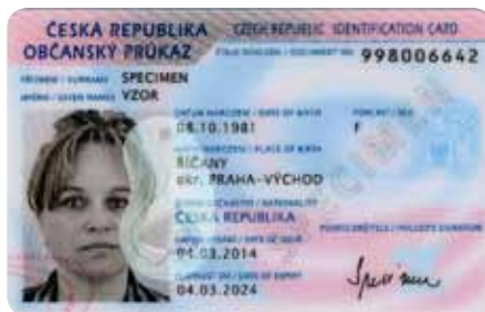
Přední strana občanského průkazu

Občanský průkaz je povinen mít občan České republiky, který dosáhl věku 15 let a má trvalý pobyt na území České republiky. Občanský průkaz může mít i občan, jehož svéprávnost byla omezena. Občanský průkaz lze na žádost vydat i občanovi mladšímu 15 let nebo občanovi, který nemá trvalý pobyt na území České republiky. Problematiku upravuje zákon č. 328/1999 Sb., o občanských průkazech, ve znění pozdějších předpisů.