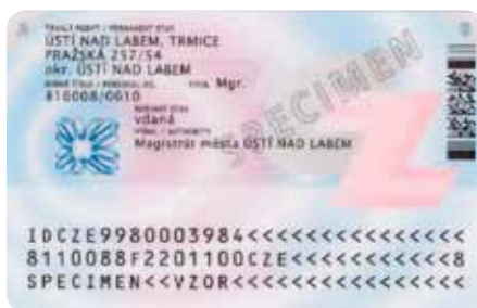
Zadní strana občanského průkazu bez kontaktního elektronického čipu