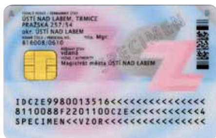
Zadní strana občanského průkazu s kontaktním elektronickým čipem

Všechny typy občanských průkazů lze použít k cestě do států Evropské unie.